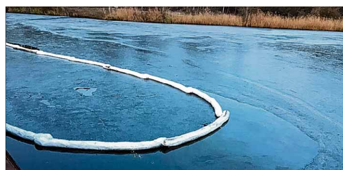
Durch eine dünne Eisschicht zeigte die Ölsperre an der Pareyer Schleuse wenig Wirkung. Feuerwehrleute aus Tangermünde wurden zur Hilfe geholt.

geschlossen. Als Fehllarm, ausgelöst von der Brandmeldeanlage in einem Einzelhandelsgeschäft, entpuppte sich dagegen der Ruf am Donnerstag in die Tangermünder Otto-Kiesel-Straße. Zwei Feuerwehrleute begaben sich trotzdem zum Ort des Geschehens, um sich zu vergewissern, dass Hilfe nicht notwendig ist. Dafür war das Fachwissen der Hansesstädter Spezialisten für Umwelt- und Gewässerschutz im Parey gefragt. Alarmiert